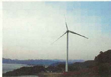
風力発電施設の設置例

令和2年4月1日から太陽光発電施設の設置に際し、環境アセス手続又は自然環境調査が必要となります。また、事業計画の届出時に調査報告書等の添付が必要となります。