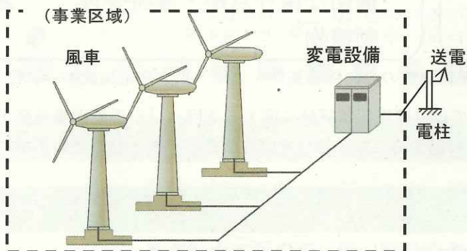
風力発電施設のイメージ