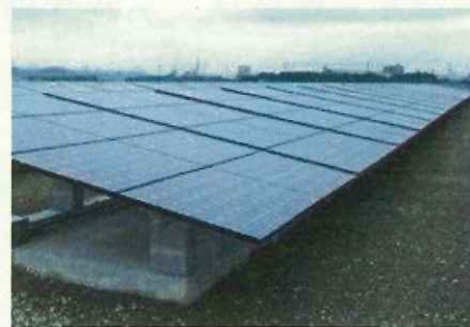
太陽光発電施設の設置例