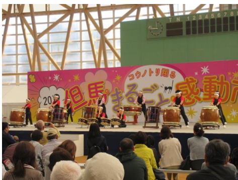
迫力満点の太鼓演奏

また、ボランティア参加団体にはPR用ブースが用意され、当協会は家電製品や太陽光発電モジュールなどの展示を行うとともに、協会のぼり旗の設置や広報用のポケットティッシュを配付して、「高度な電設技術で安心・安全な社会づくり」に貢献している兵庫県電業協会の公益活動を広くPRしました。