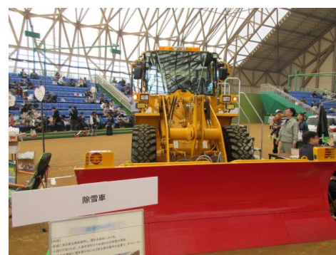
働く車（除雪車）も展示