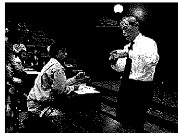
平成19年に実施した講習会の様子