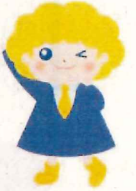
パートタイム・有期雇用労働法 キャラクター「ハゆう」ちゃん